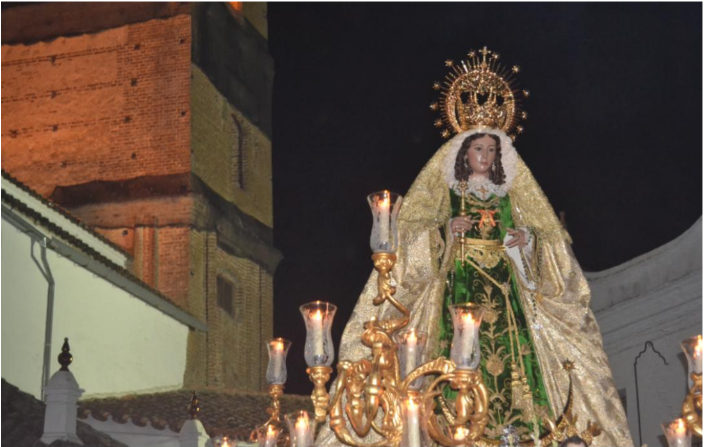
La Virgen de Guaditoca en procesión el pasado viernes