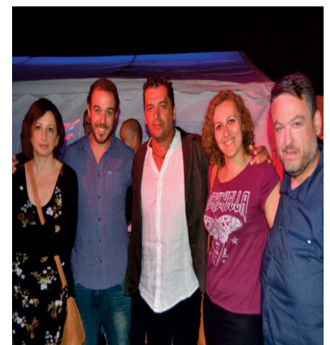
Concejales en La noche del terror

jueves. El acto que consistió en un pequeño pase por la casa de la cultura de la localidad vecina guiado por el primer edil de San Nicolás, mostró a los asistentes lo que deparará a los visitantes este fin de semana y sirvió como reflejo de la unión existente entre los ayuntamientos que conforman la comarca de la sierra norte de sevilla.