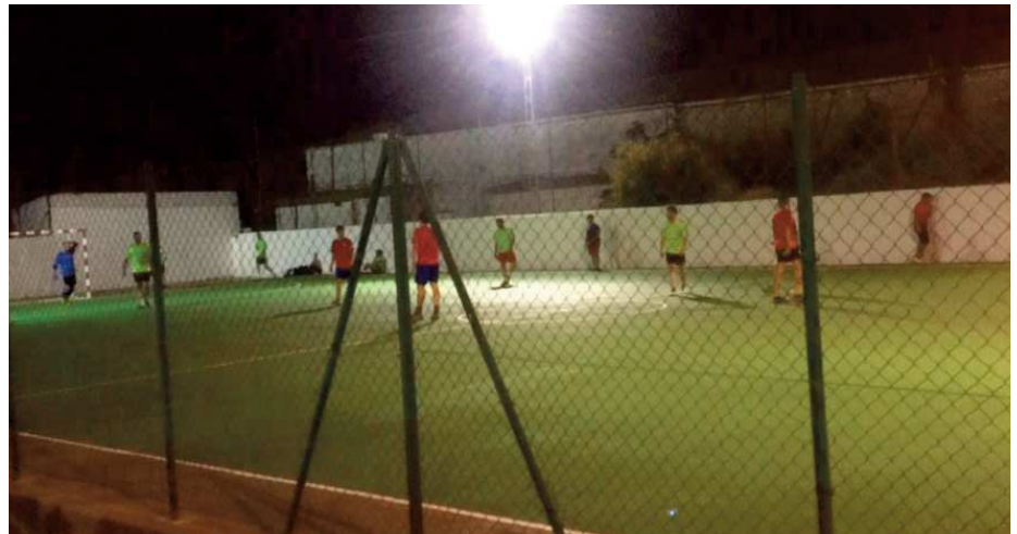
Imagen de un partido de la categoría senior