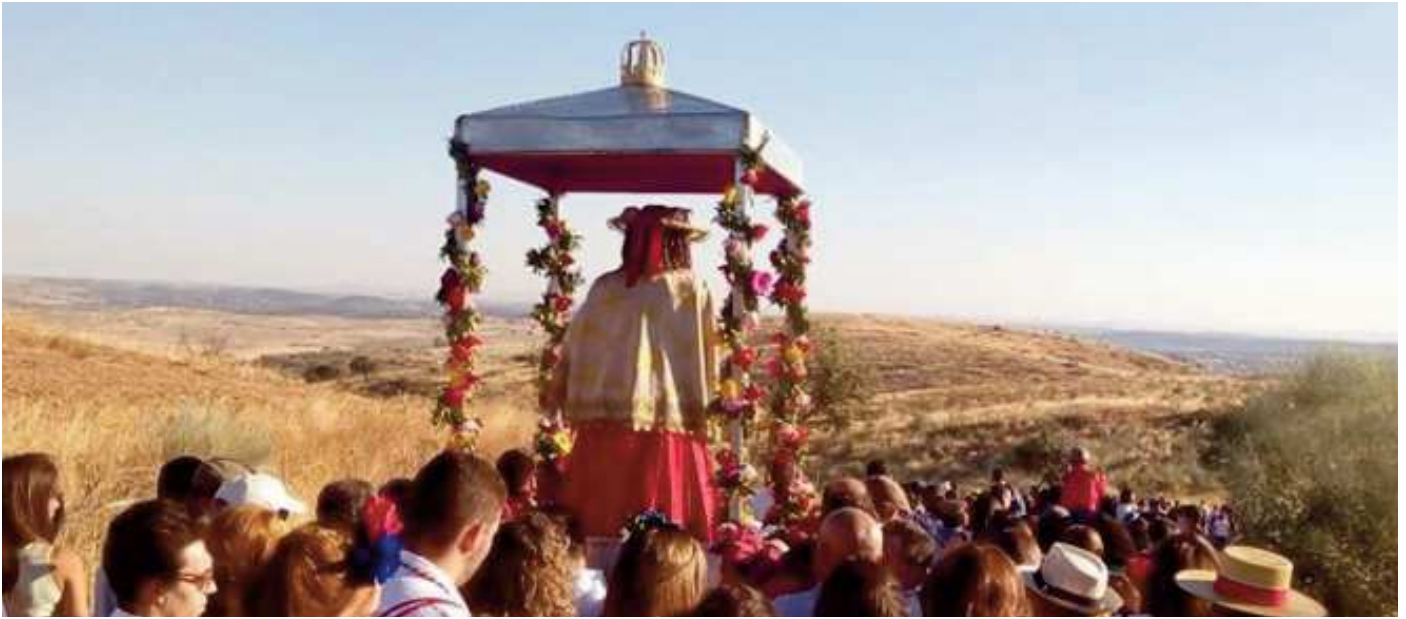
Imagen de Ntra. Sra. de Guaditoca en la pasada romería de abril