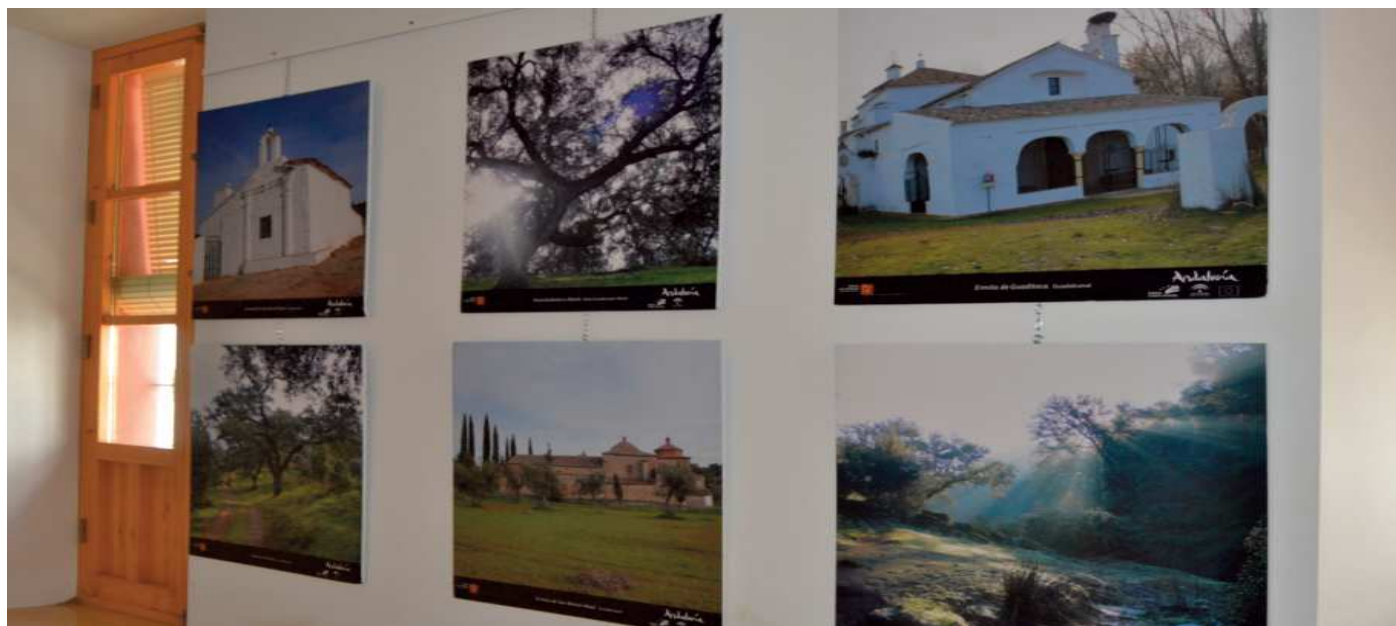
Imágenes de la exposición Ermita y Camino en la Casa de la Cultura