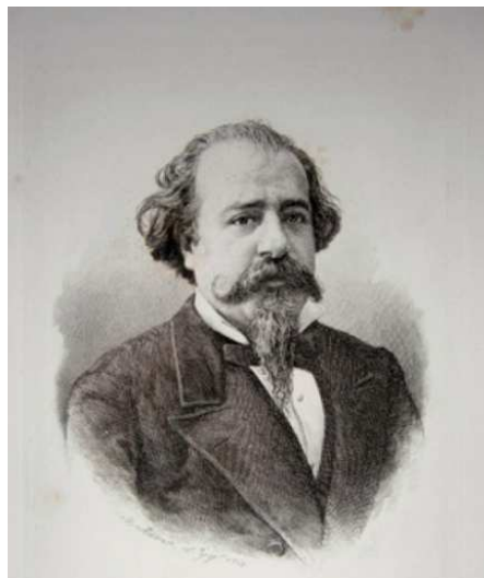
Retrato de López de Ayala

Pues bien, esa cabeza representa a uno de los cerebros más grandes que ha dado el pueblo de Guadalcanal. Se trata del busto de Adelardo López de Ayala , escritor y político español que nació en nuestro querido pueblo cuando este aún pertenecía a la provincia de Badajoz , allá por el año 1828. Trasladose a Sevilla para estudiar bachillerato y la carrera de derecho, aunque nunca llegó a terminarla debido a su enfrentamiento con la autoridad académica y tuvo que