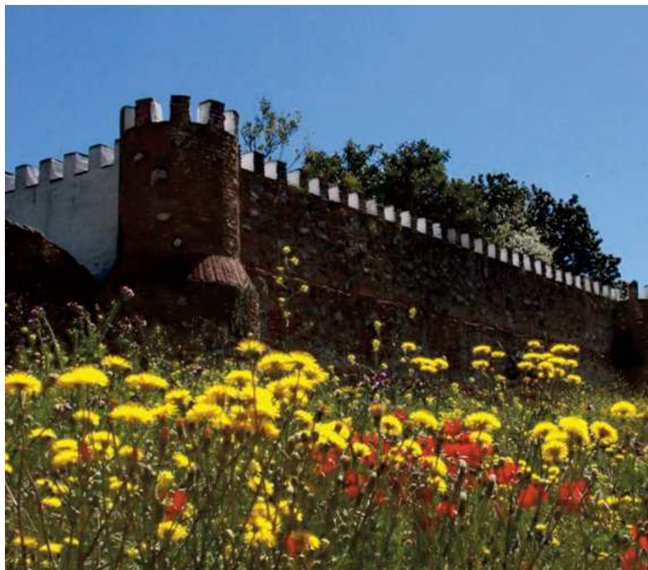
Fortaleza de la casa rural La Florida del Valle