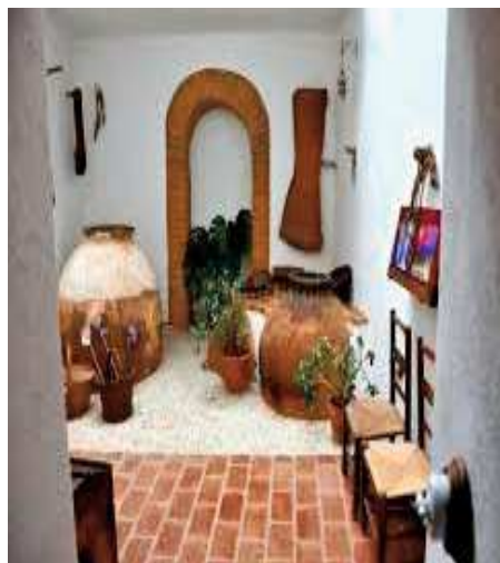
Casa rural Pozo Berrueco GI

Hoy en día es muy sencillo ofertarse en las redes sociales y esto puede provocar que haya alojamientos a los que no les interesen darse de alta, por pensar, quizás, que se ahorran dinero, cuando en realidad, invertir en calidad es asegurarse un futuro próspero en el sector.