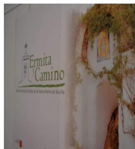
Ermita y Camino

del desarrollo económico y del turismo y en la cual, además de las fotografías de las que consta la exposición, se ofrecen datos sobre las distintas ermitas de la comarca, enmarcadas en su contexto histórico y arquitectónico y se ofrecen distintas rutas para llegar hasta ella y para orientar por sus caminos al visitante.