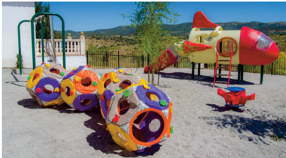
Los tomillares, un establecimiento equipado con parque infantil GI