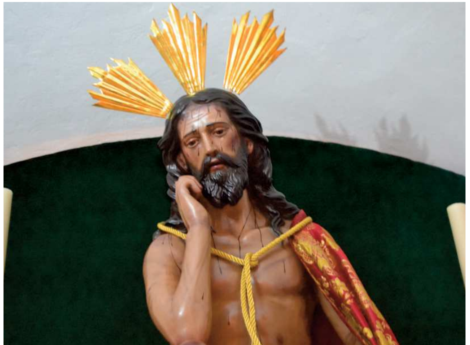
Stmo. Cristo de la humildad y paciencia de la Hdad. del Costalero

Curiosidad dentro de curiosidad, resulta que los titulares de esta hermandad llegaron a procesionar en