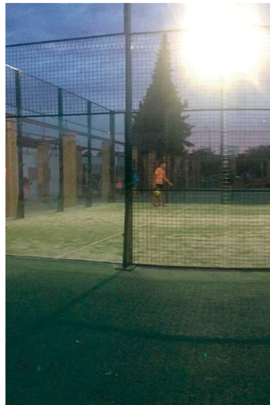
El pádel gana enteros últimamente y at

Además de esta competición, durante todo el año, y especialmente en verano, se puede participar en torneos de tenis, de futsal (es igual que el futbito pero en césped). O también de pádel. Este deporte, en auge ahora en nuestra localidad celebra hasta tres campeonatos al año, entre los que organiza el ayuntamiento, y los que promueven las distintas asociaciones locales. Es también en estas fechas cuando se