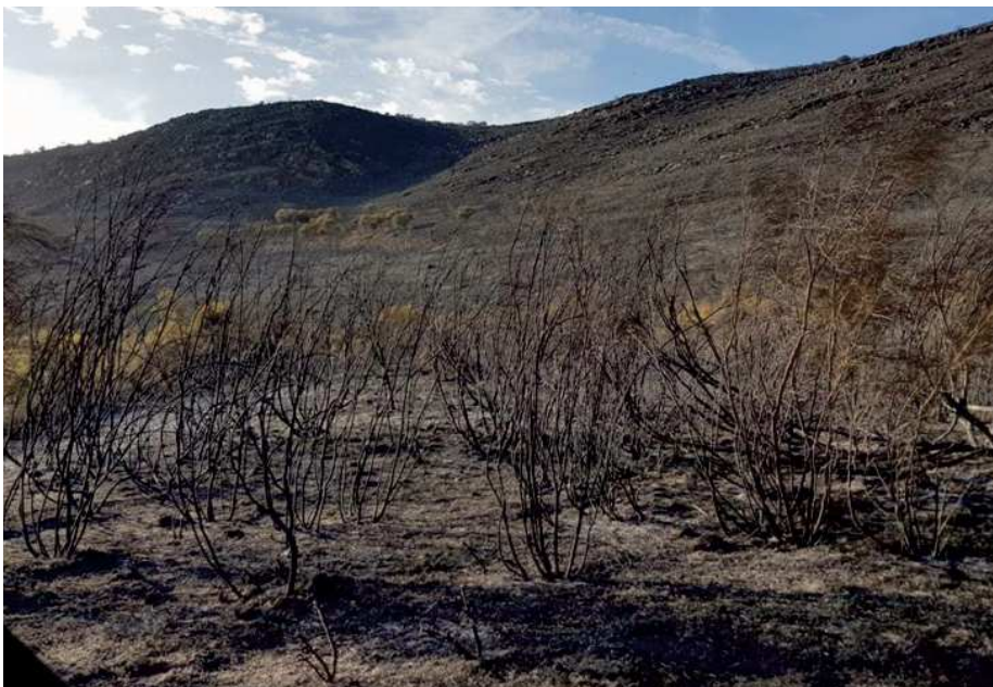
Zona de la Sierra del Agua calcinada por el fuego