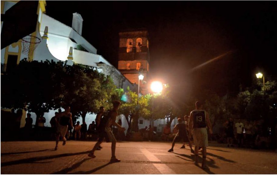
La Plaza de España albergó una nueva edición del 3x3 de baloncesto GI