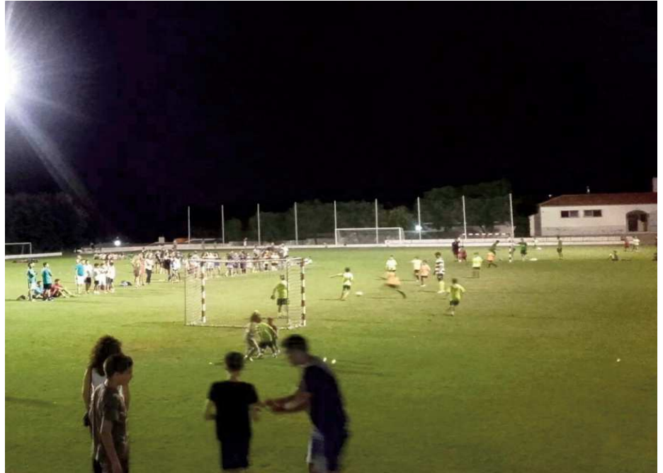
Imagen de la primera edición del Futsal de la Resurrección

En esta ocasión serán 19 equipos que participen en las categorías senior masculino y femenino, amén de una categoría infantil y otra cadete. La organización proporcionará camisetas a todos los participantes, además de premios en metálico para los dos