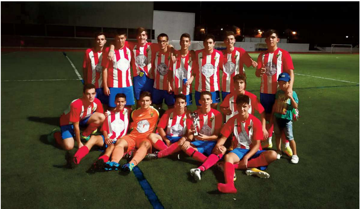
Los campeones del Trofeo de Feria celebrándolo sobre el césped