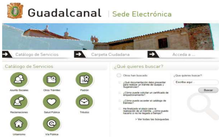
Imagen del apartado de la web destinado a la sede electrónica GI

De esta manera ya no es necesario la presencia física del interesado en dependencias municipales para llevar a cabo tramites como reconocimiento de la situación de dependencia, la solicitud de celebración de enlace civil, presentación de quejas, reclamaciones y sugerencias o la obtención del cer-