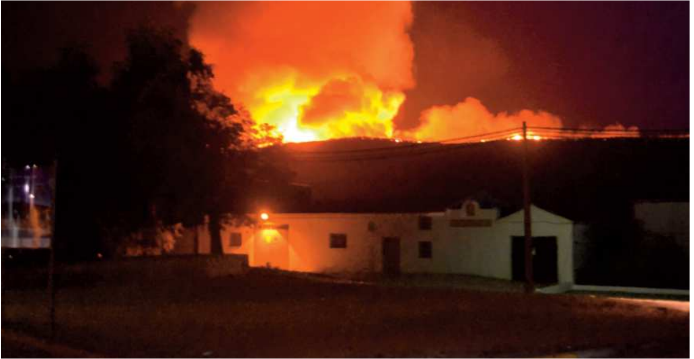
Imagen del incendio de la Sierra del Agua el pasado domingo