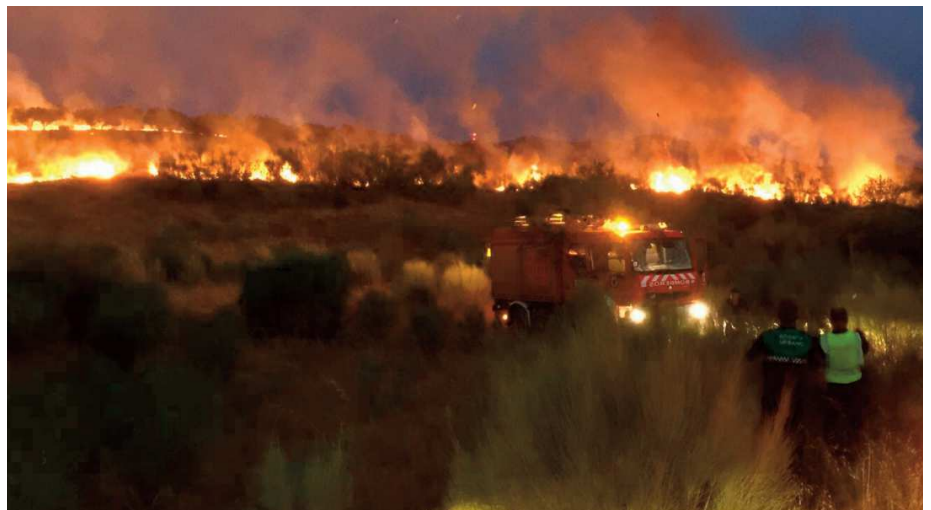
tercer incendio, el pasado 27 de julio

El tercer fue en cuestión tuvo lugar el pasado miércoles, y se desató sobre las nueve de la noche. Declarado en las inmediaciones de la estación ferroviaria, hasta el lugar de los hechos se desplazaron un total de dieciséis bomberos forestales, además de un agente medioambiental y un vehículo autobomba, amén del personal del propio ayuntamiento. El incendio quedó controlado a las 00:45 siendo extinguido a la 01:20.