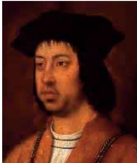
Fernando El Católico

Podemos presumir en Guadalcanal de ilustres personajes que gracias a sus andanzas llevan el nombre de Guadalcanal más allá de la frontera. Eso, en cuanto a hechos contrastados. Ahora bien, más aún podemos presumir de historias que, sin un clara prueba tangible nos encumbran y nos hacen partícipes de la historia, como es el caso de la descendencia de Fernando de Aragón, quien uniera su reino al de Isabel de Castilla, formando la dupla conocida como Los Reyes Católicos. Fue Fernando uno de los precursores de la expulsión de los judíos allá por 1492. Seguramente porque no sospechaba que en sus propias venas corría sangre judía. ¿Cómo podía ser tal cosa? Es sencillo. De más es sabido que era