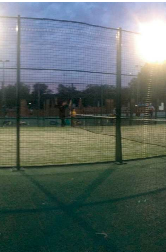
Hay muchos jugadores foráneos MB

tero, en el que se mezcla el colorido de un espectacular deporte con el entorno urbano del centro de la localidad. Además Guadalcanal a parte de tener competiciones de natación de carácter local, participa en regionales.