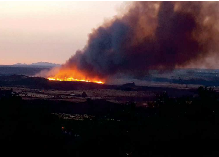
Los primeros incendios tuvieron lugar el 23 y 24 de junio