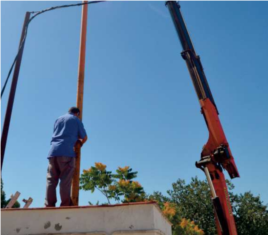
Segunda extracción del día en Coso Alto