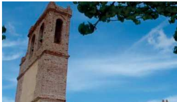
Santa Ana, La Almona y Santa María de la Asunción, primeros monumentos con QR