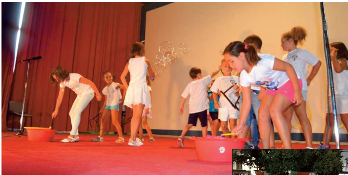
Alumnos de la escuela de verano en plena actuación