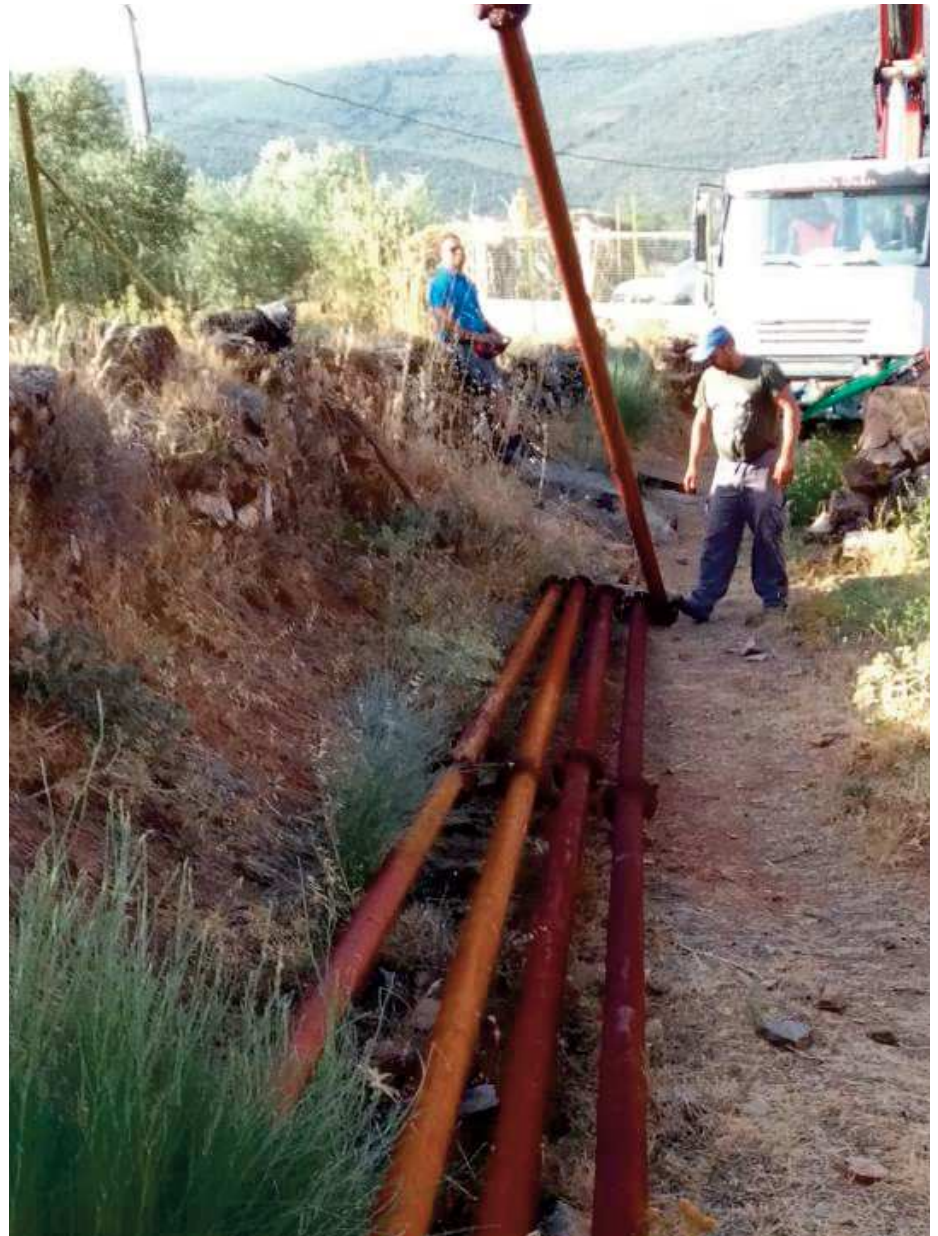
Operarios extrayendo la primera de las bombas