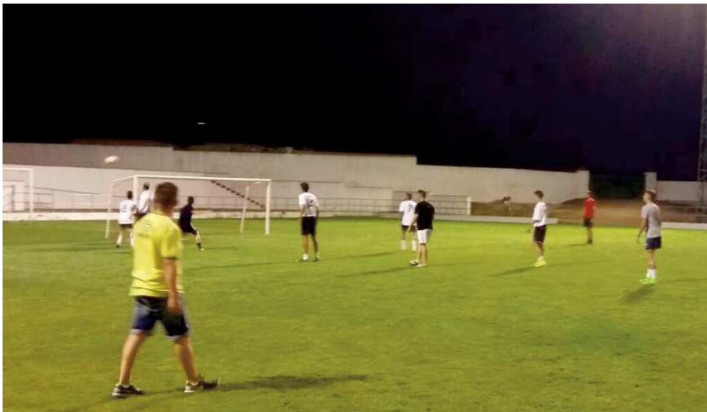
Momento del campeonato de futbol 7 disputado el pasado fin de semana