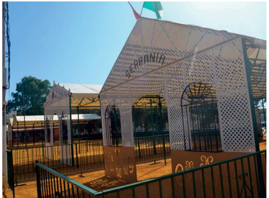
Una de las casetas que ya tiene su estructura montada

Dos momentos marcarán la feria como es costumbre. Uno de ellos tendrá lugar el viernes con la tradicional final del Trofeo de Feria que aglutina cada año a un gran número de seguidores. De la misma manera, el sábado el protagonismo será para Nuestra Señora de Guaditoca, que una vez más pisará el