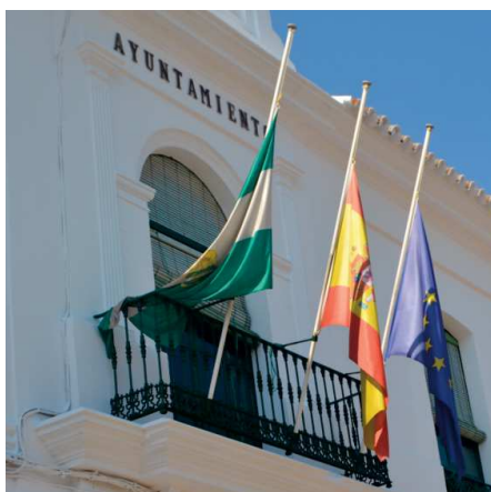
Banderas ondeando a media hasta

El nuevo atropello se saldó con seis personas heridas, una de ellas en estado grave y otra en situación crítica.