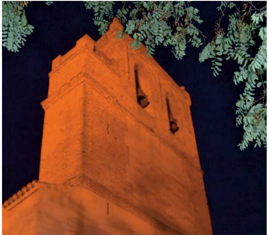
Santa Ana será el primer edificio con código QR

El procedimiento es sencillo. Tras ser escaneado con sus dispositivos móviles (teléfonos, tablets y otros dispositivos con acceso a datos) se mostrará al visitante tanto un video explicativo del monumento, como un audioguía que le sirva al usuario para interpretar el patrimonio visitado. “La apuesta por el QR es un acercamiento de las nuevas tecnologías en materia de turismo y las nuevas tendencias museográficas para abarcar una mayor accesibilidad a un público que está cada vez más familiar-