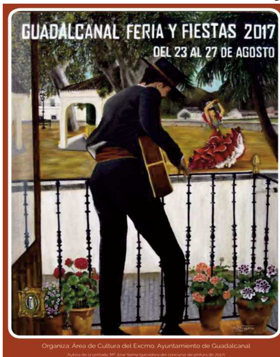
Cartel de la revista de feria 2017

Coincidiendo con la última semana de agosto, Guadalcanal prepara ya su feria 2017. Los festejos comenzarán el miércoles día 23 de agosto con la tradicional prueba del alumbrado, en un día dedicado a los más pequeños con rebaja en las atracciones. Los niños volverán a ser protagonista con una gala infantil en la tarde del jueves y con los juegos tradicionales como las carreras de cintas, ollas y sacos. El deporte comenzará el jueves con la final juvenil de fútbol, mientras que el viernes tendrá lugar la senior. Los amantes del caballo podrán pasear a sus ejemplares en horario de 14:00 a 19:00 y la música correrá cada día a cargo de las orquestas Cobalto, Nueva Fase y Atracción en la Caseta Municipal.