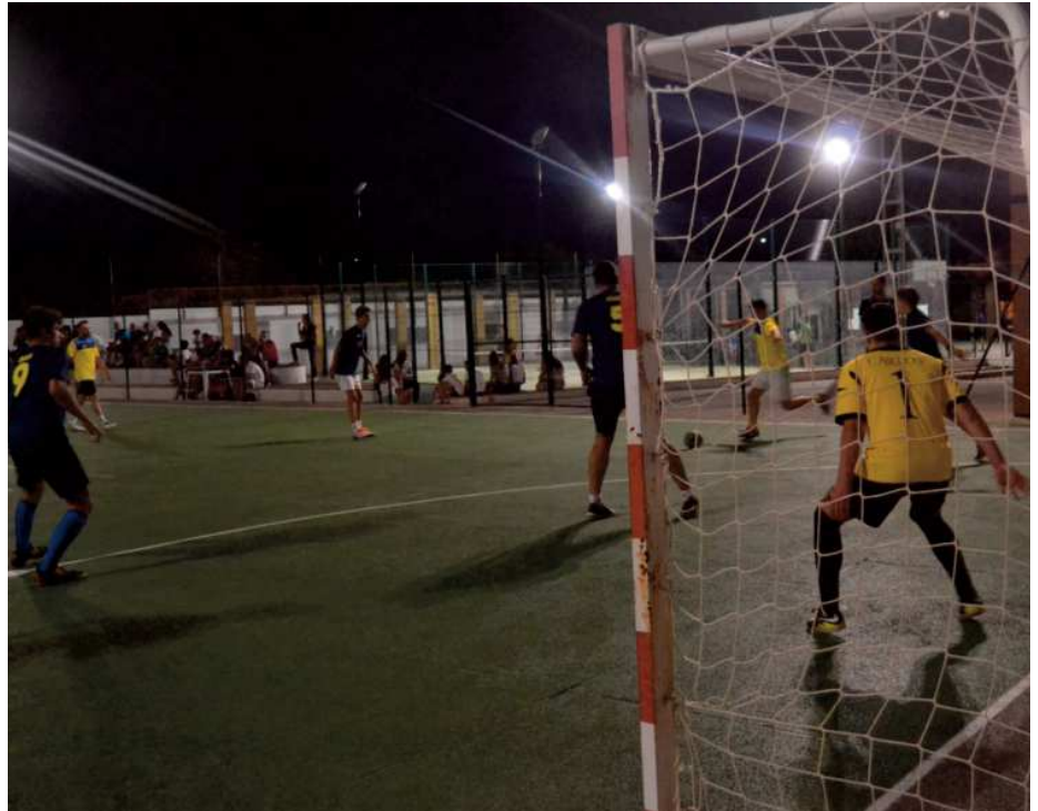
Un momento del partido entre Fuente del Arco y Los hombres de Nosa GI