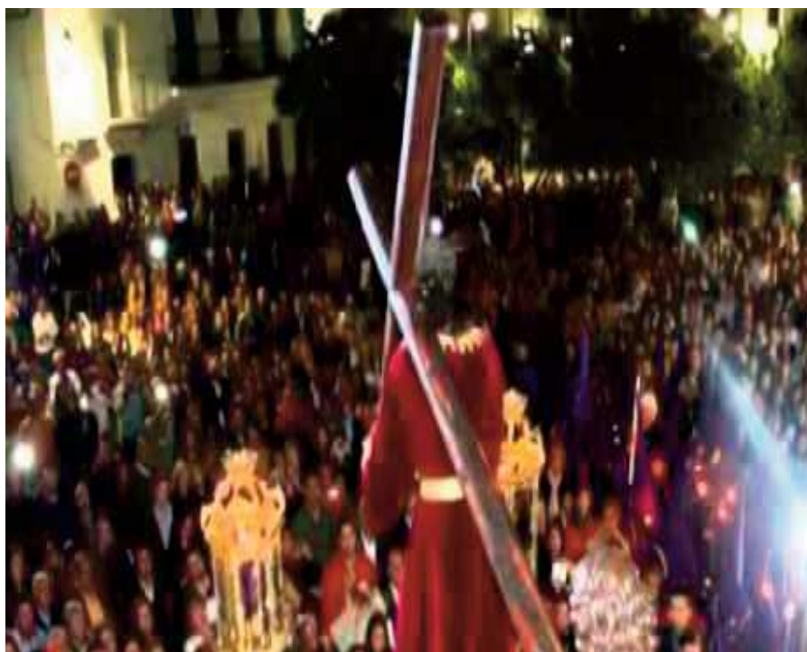
Nuestro Padre Jesús durante un momento de su salida

Cristo Amarrado a la columna y María Stma de la Cruz. Una de las salidas que más público congrega es la de la Hermandad de Ntro Padre Jesús Nazareno y María Stma de la Amargura, que lo hace a las cinco de madrugada del Viernes Santo. Ese mismo día, por la tarde, hace estación de penitencia la Hermandad del Santo Entierro con Cristo en el Santo Sepulcro y Ntra. Sra. de la Soledad. Mientras que un día más tarde lo hace la Hermandad de las Tres Horas con el Stmo Cristo de las Aguas y Ntra. Sra. de los Dolores. La Semana Santa pone su broche final con la Agrupación Parroquial de la Resurrección con el Stmo. Cristo Resucitado y Santa María Magdalena, el Domingo de Resurrección.