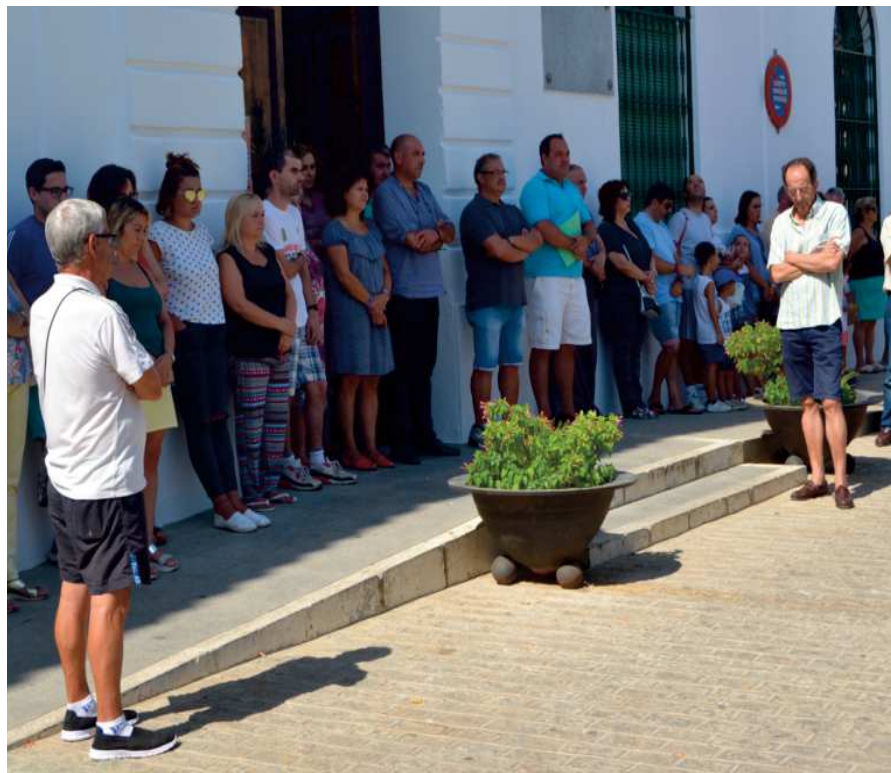
Políticos y vecinos guardando cinco minutos de silencio por las víctimas GI