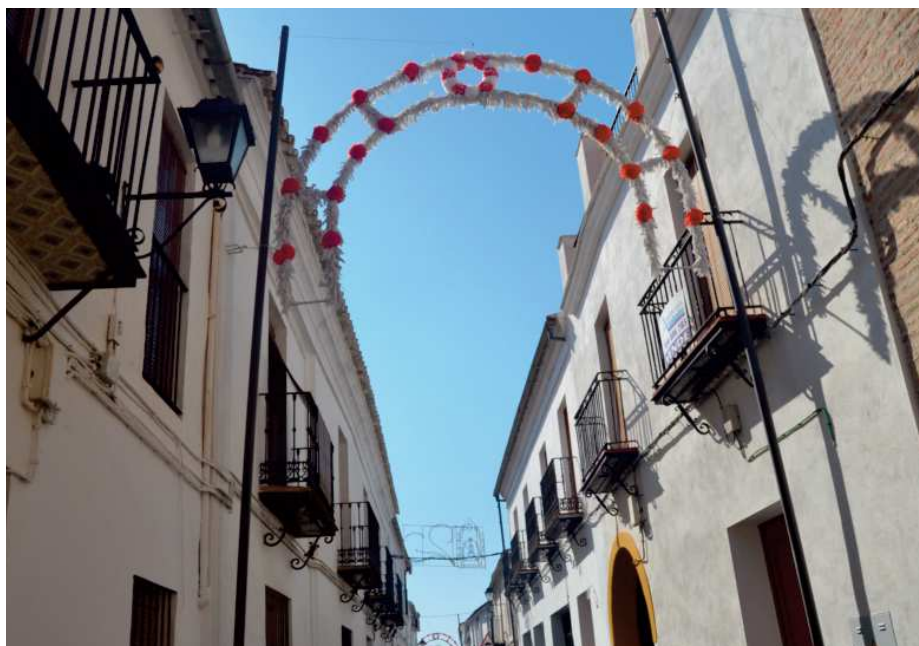
Detalle de la nueva decoración de la Calle Concepción para la feria