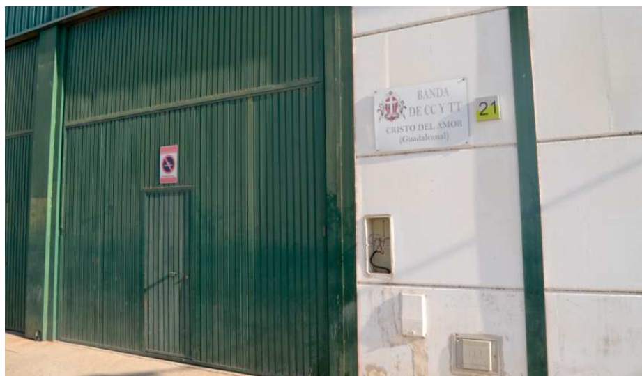
Local de ensayo de la Banda de Cornetas y Tambores