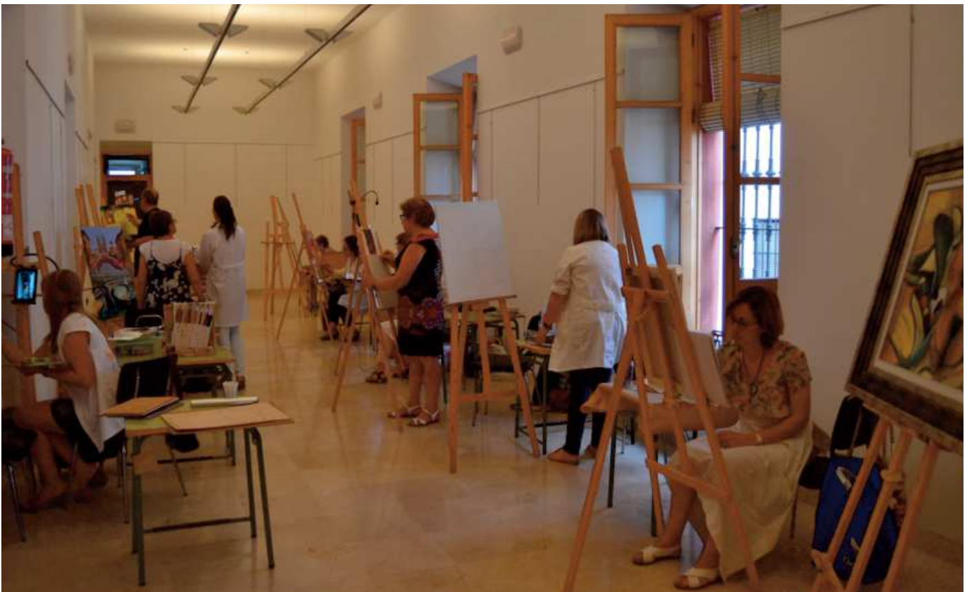
Aula de pintura de la Casa de la Cultura