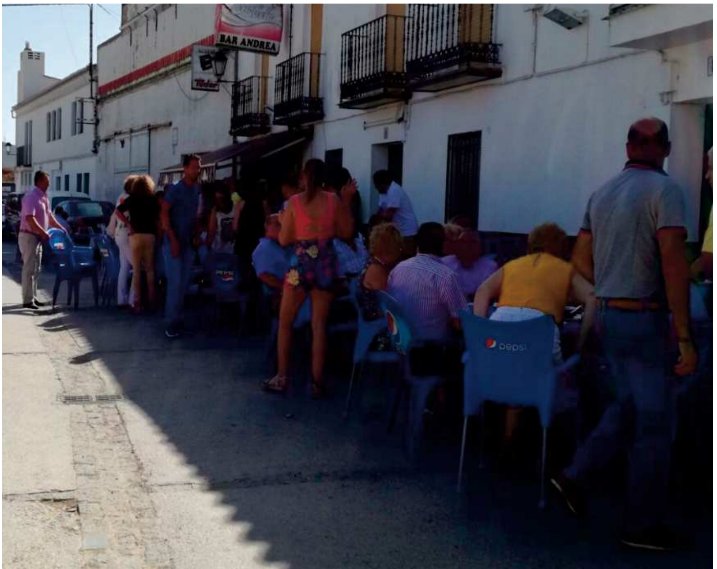
Imagen de un momento de la ruta de la tapa de este año