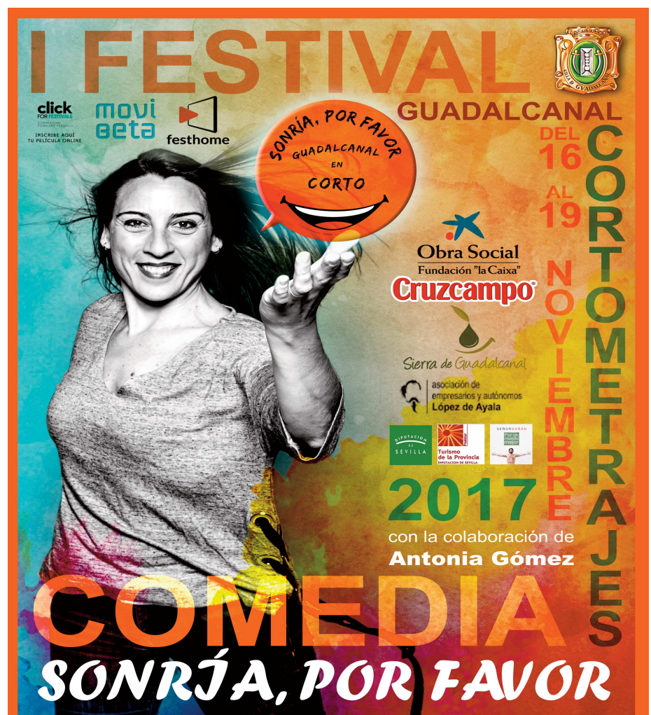
Cartel anunciador del Festival de cortometrajes de Guadalcanal

A falta de cerrar el protocolo pertinente, todo hace indicar que el premio será entregado por un representante de la Fundación La Caixa en la gala final del festival y que será la familia del pequeño de Guadalcanal afectado por la distrofia quien lo reciba.