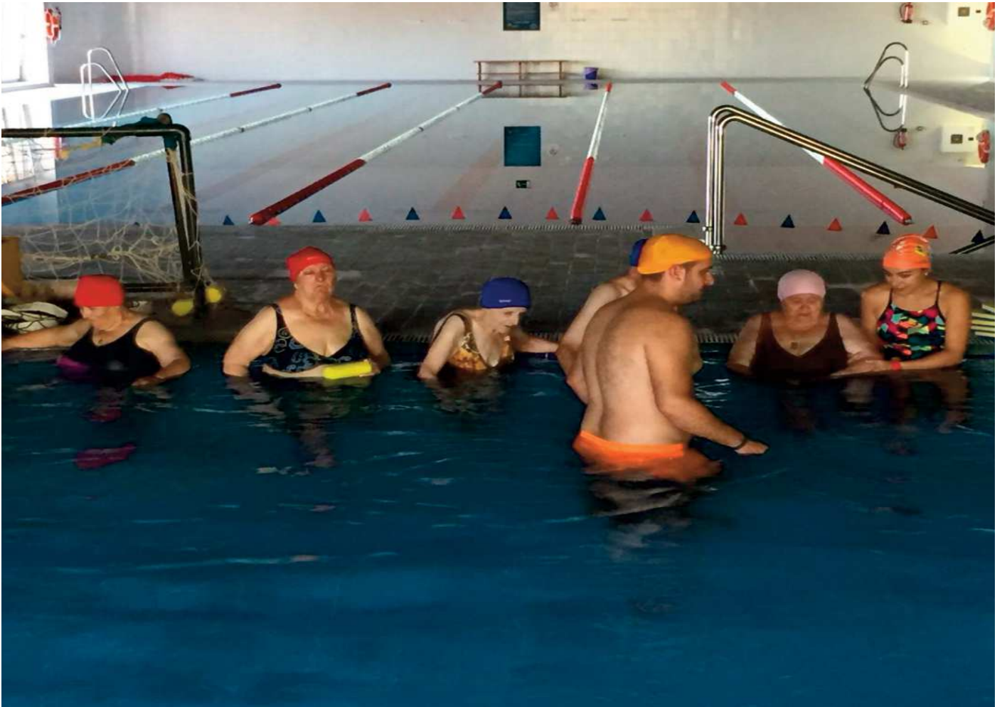
Usuarios de la residencia de Mayores de Guadalcanal en la piscina cubierta de Constantina