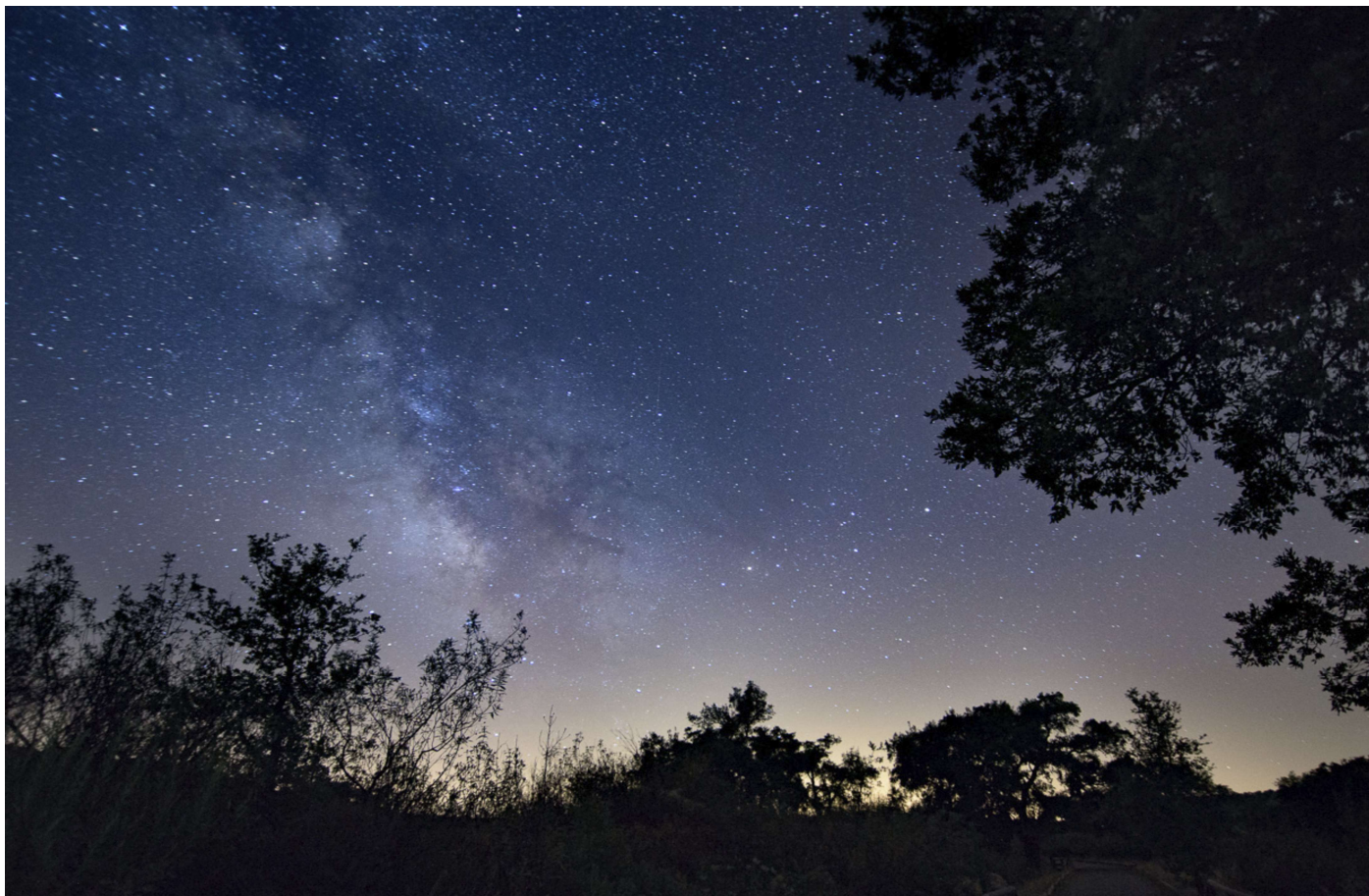
Imagen del cielo de Guadalcanal, nuevo atractivo turístico