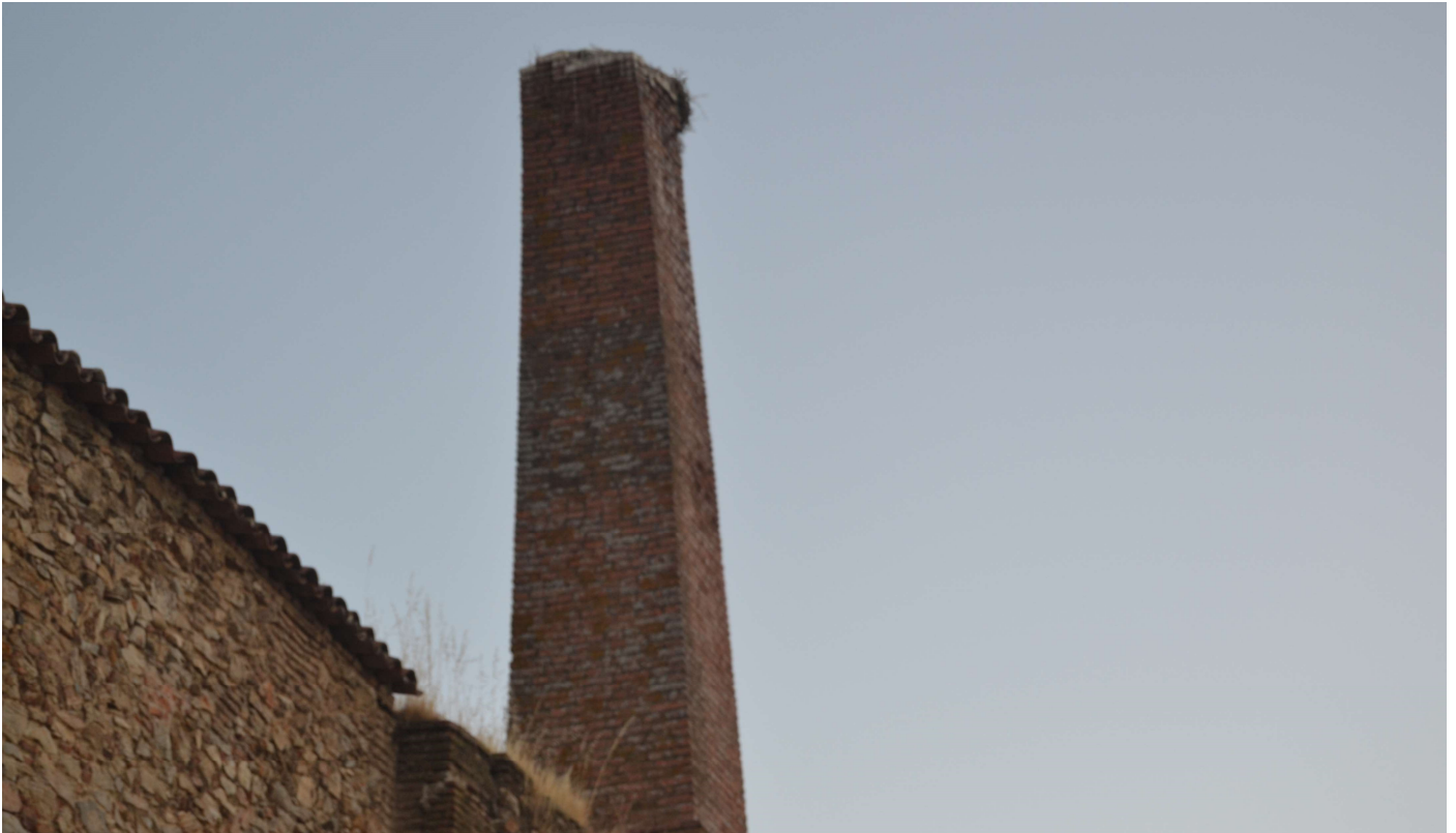
Chimenea de la antigua fábrica de harinas de la Calle Santa Clara