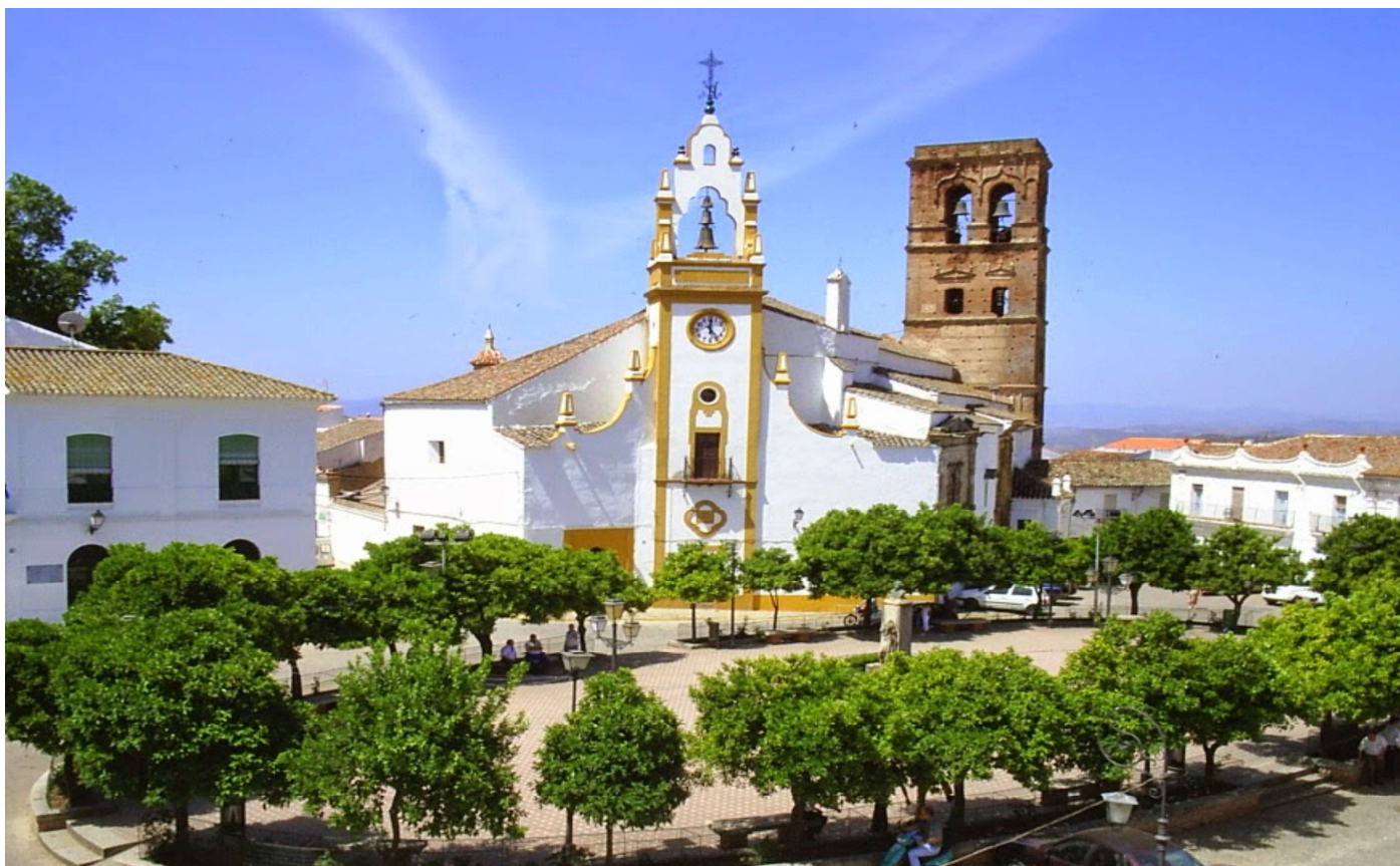
Imagen de la parroquia de Santa María de la Asunción en la Plaza de España