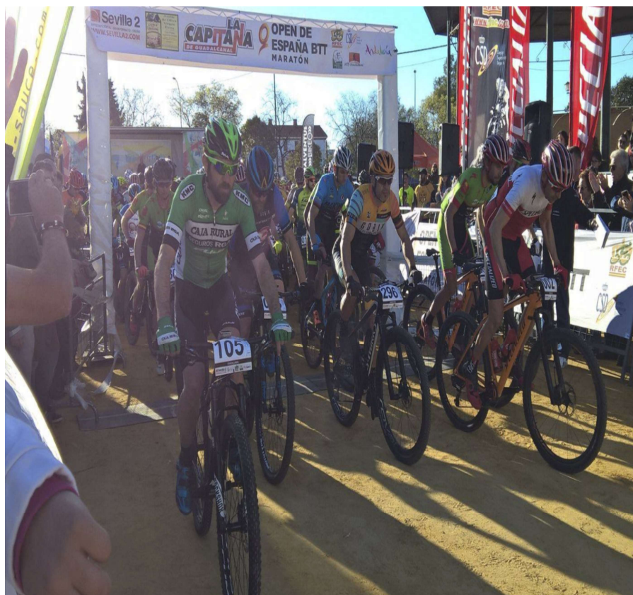
Imagen de la última edición Maratón Capitana Javi Cabeza GI