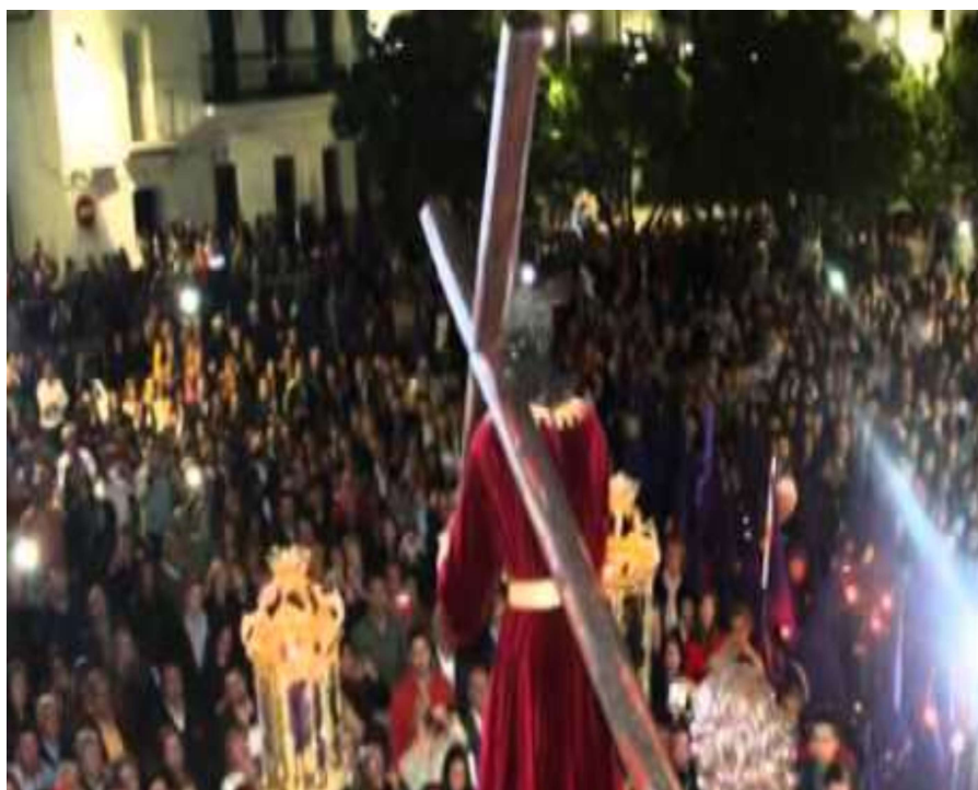
Nuestro Padre Jesús durante un momento de sus salida

Cristo Amarrado a la columna y María Stma de la Cruz. Una de las salidas que más público congrega es la de la Hermandad de Ntro Padre Jesús Nazareno y María Stma de la Amargura, que lo hace a las cinco de madrugada del Viernes Santo. Ese mismo día, por la tarde, hace estación de penitencia la Hermandad del Santo Entierro con Cristo en el Santo Sepulcro y Ntra. Sra. de la Soledad. Mientras que un día más tarde lo hace la Hermandad de las Tres Horas con el Stmo Cristo de las Aguas y Ntra. Sra. de los Dolores. La Semana Santa pone su broche final con la Agrupación Parroquial de la Resurrección con el Stmo. Cristo Resucitado y Santa María Magdalena, el Domingo de Resurrección.