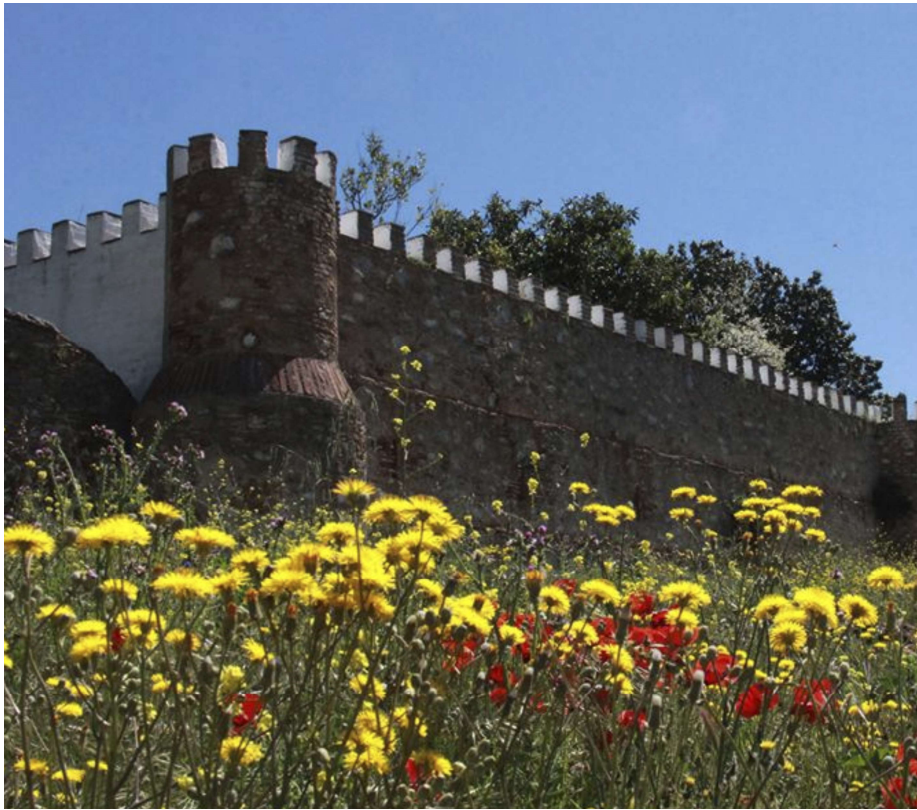
Fortaleza de la casa rural La Florida del Valle