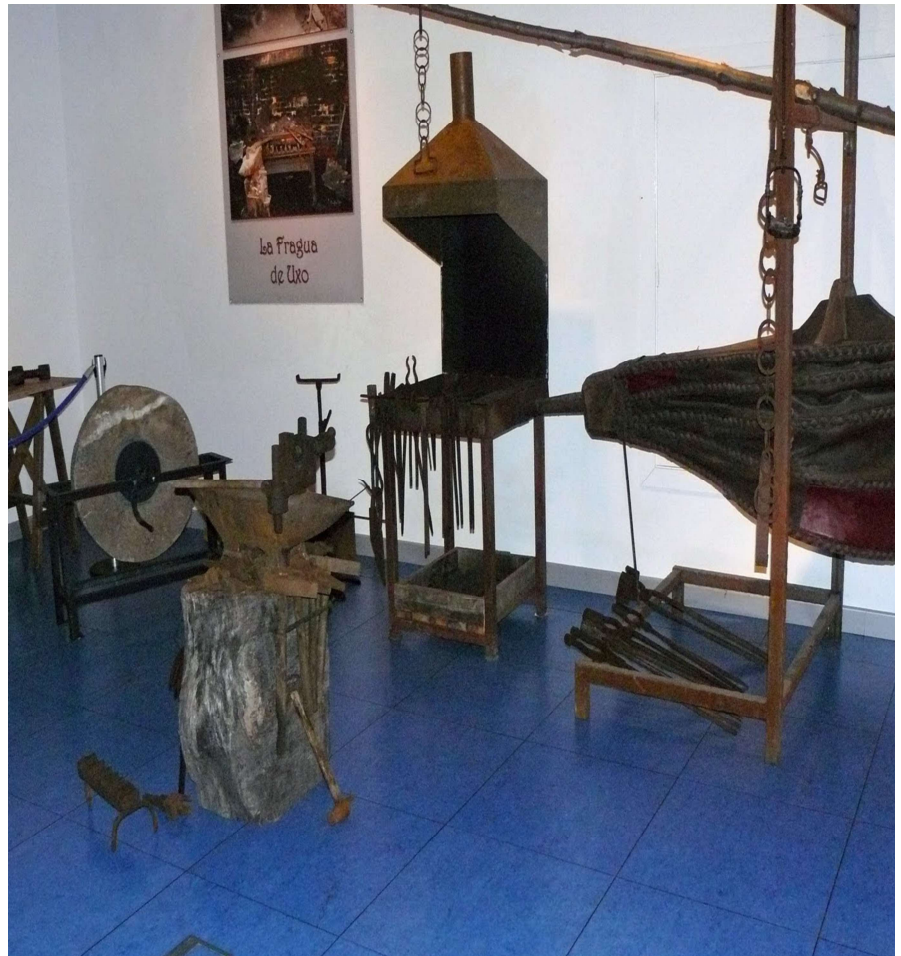
Fuelle de una mina expuesto al público