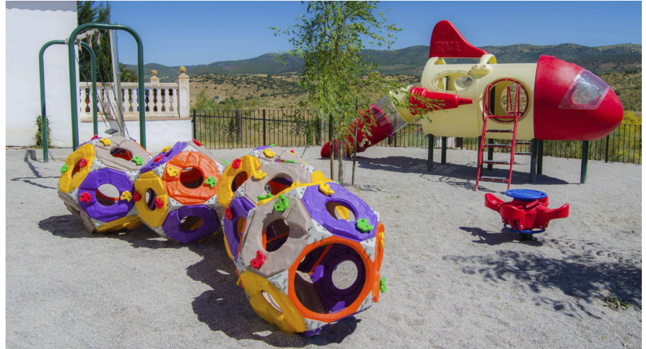
Los tomillares, un establecimiento equipado con parque infantil GI