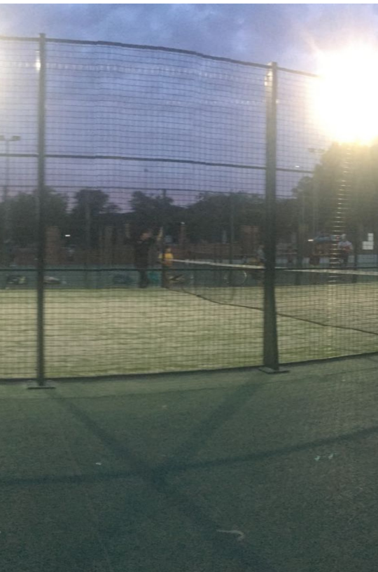
rae muchos jugadores foráneos MB

entorno urbano del centro de la localidad. Además Guadalcanal a parte de tener competiciones de natación de carácter local, participa en regionales. Por otra parte, y hablando del deporte rey, el fútbol, Guadalcanal tiene una enorme tradición futbolera que le lleva a inscribir a su equipo en la competición provincial, atrayendo a un gran número de aficionados, en especial, cuando se disputan partidos de atractivo regional.