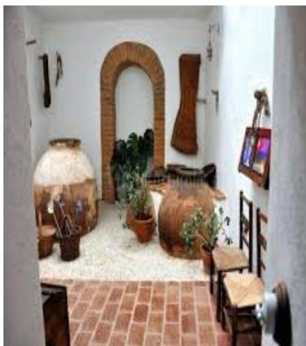
Casa rural Pozo Berrueco GI

Hoy en día es muy sencillo ofertarse en las redes sociales y esto puede provocar que haya alojamientos a los que no les interesen darse de alta, por pensar, quizás, que se ahorran dinero, cuando en realidad, invertir en calidad es asegurarse un futuro próspero en el sector.