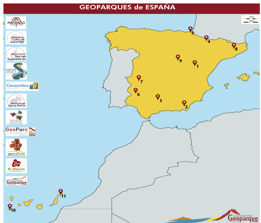
Mapa de los Geoparques de España

De todos ellos, tres son andaluces: el de la Subbéticas, el de Cabo de Gata-Nijar y el de Sierra Norte de Sevilla, que es al que pertenecemos.